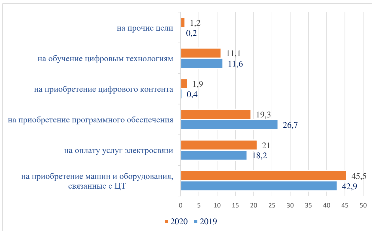
Рис. 1. Структура внутренних затрат организаций, % [1]